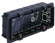
V71306.AU - Boîte d'encastr.rectang. 6-7M noir