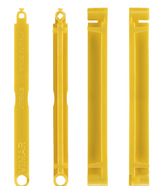
V71563 - Plaquette de jonction boîte enc. jaune